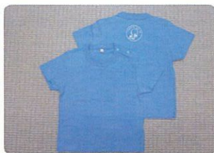
■ラボグッズの一例