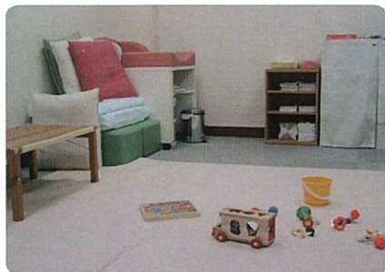
■おむつ替え・授乳スペース